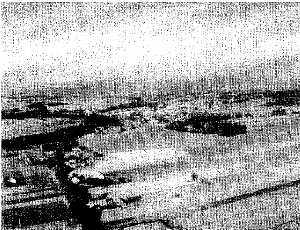
Rysunek 4. Panorama Żelechlinka z lotu ptaka