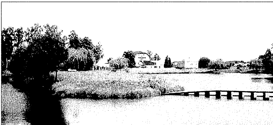
Rysunek 1. Zbiornik retencyjny w Żelechlinku

Cześć terenów znajduje się w granicach stanowisk archeologicznych.