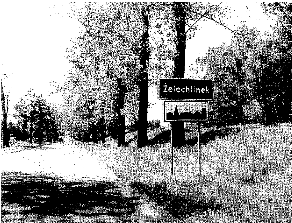
Rysunek 3. Krajobraz Żelechlinka